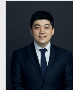
김광의 ESG 공시 · 평가대응