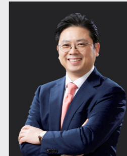
이행규 자본시장 · 공시