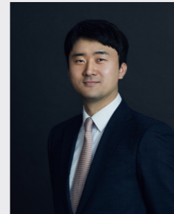
장품 공급망 · 그린워싱