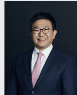
신민 지배구조 · 환경